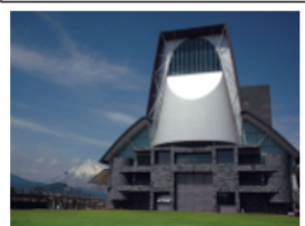
静岡県コンベンションアーツセンター GRANSHIP

駐車場は、普通乗用車400台（うち車椅子使用者用7台）がご利用頂けますが催事の開催状況によっては満車となる場合があります。 近隣には他の駐車場がありませんので、できるだけ公共の交通機関をご利用くださいますようお願い申し上げます。